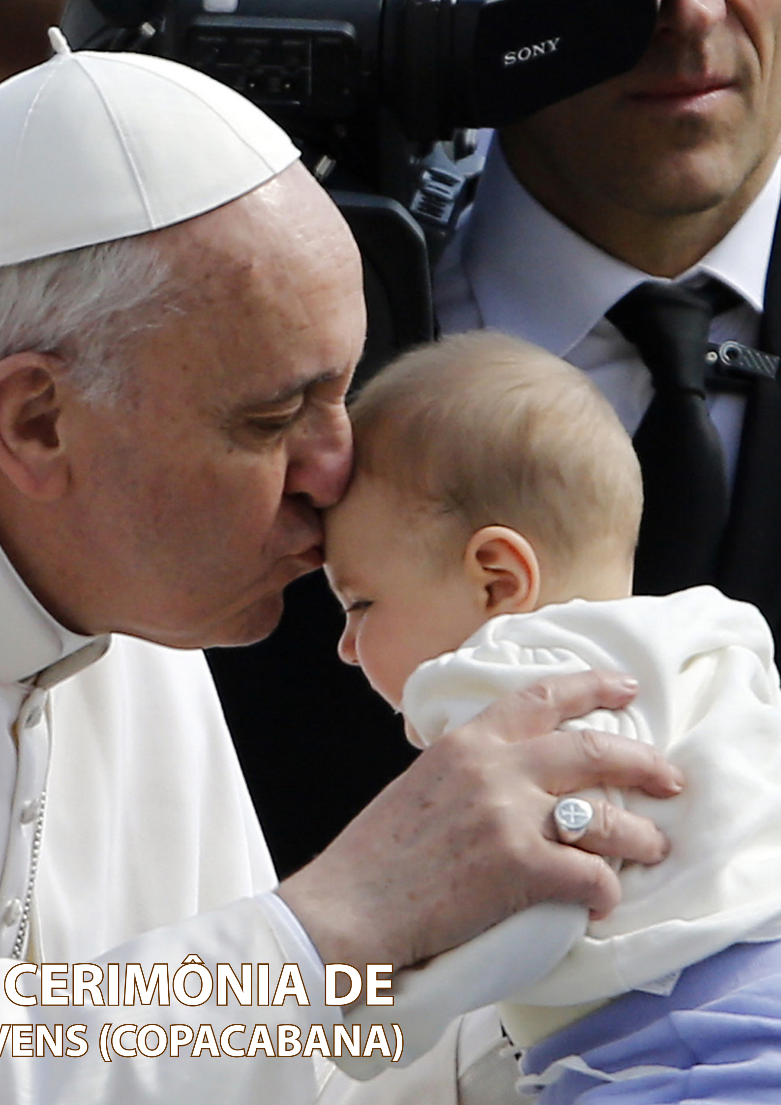
CERIMÔNIA DE BÊNÇÃO DE BEBÊS (COPACABANA)